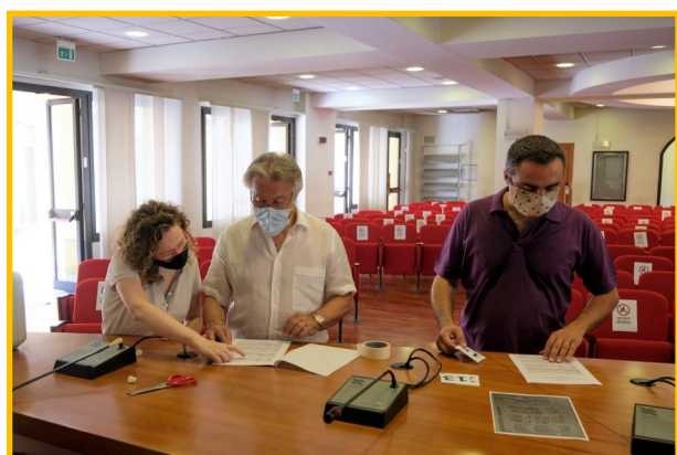
L'assegnazione dei posti distanziati