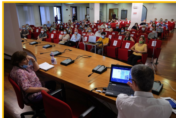
Il pubblico in posti distanziati