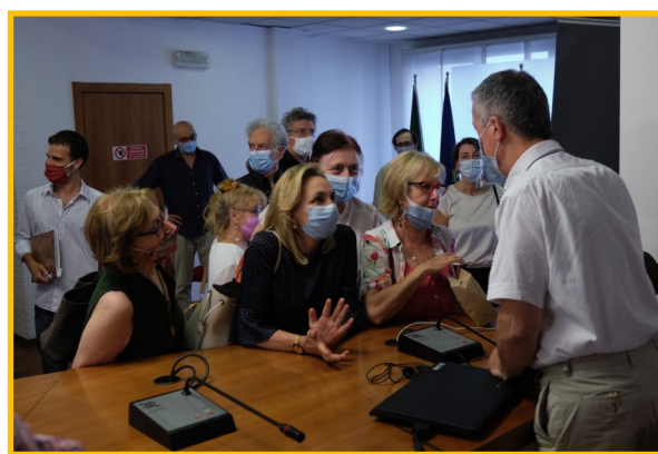
Alla fine tante domande e tante dediche