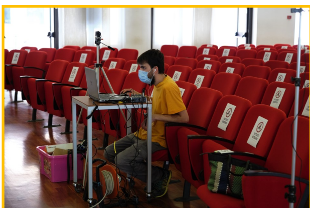
La regia per le riprese sui social