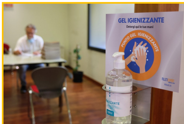
Le postazioni per igienizzarsi