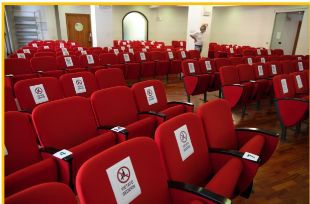
Poltrone distanziate come da regolamento