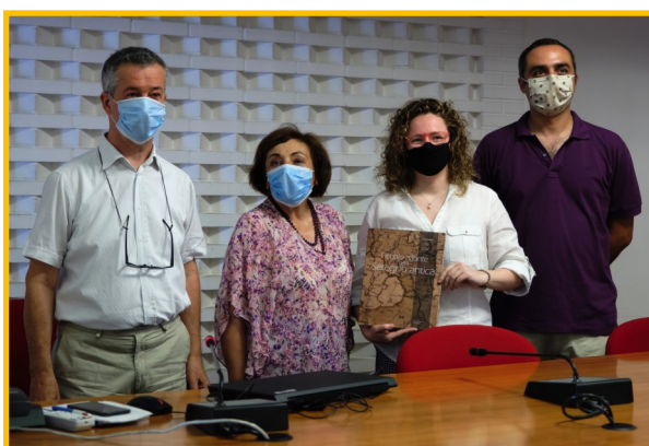
I relatori di Seregn de la memoria