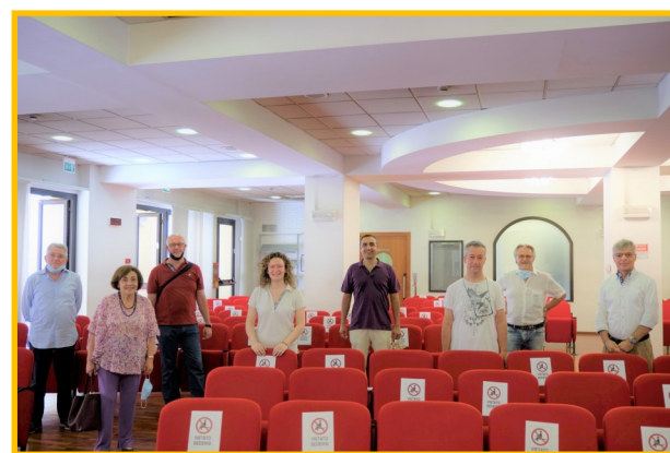
La squadra di volontari al completo